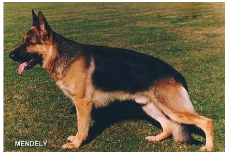
Fanto Hirschel f. 13.03.1986 SZ 1668730

På denne faderlinie finder vi sønnen Sonny v. Badener Land videre til VA Tell v. Grossen Sand herfra til Sieger 1990 -1991 Fanto Hirschel.