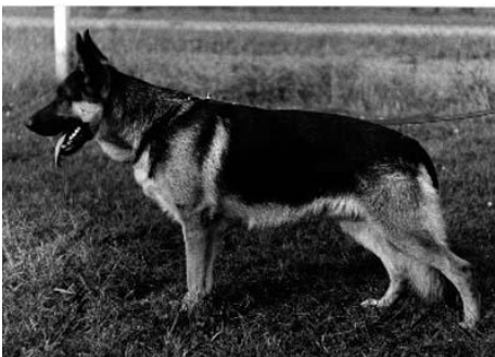
Elch v.d. Wienerau f.28.02.1960 (Cäsar v.d. Malmansheide- Berta v. Lorcher Sand)

Allerede i 1959 blev Asso v.d. Wienerau SG 2 i unghundeklassen og i 1961 blev Elch v.d. Wienerau unghundevinder.