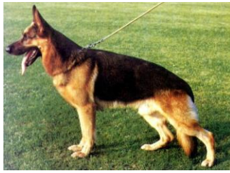
Eros Malvenburg f. 01.02.1975 SZ 1347778 Mor er Anke Grubenzolz

En anden stærk linie går helt frem til en VA hund fra 2013 Mentos v. Osterberger Land.