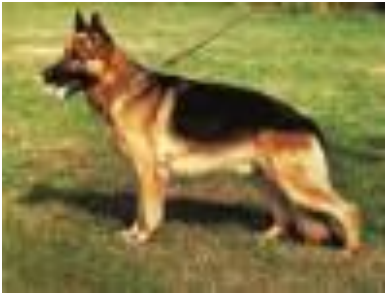
Canto v. Arminius f. 18.08.1972 mor er Ecclesia Nova en Quanto v. d. Wienerau datter.