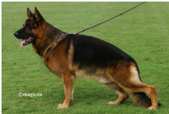
VA Mentos v. Osterberger Land f. 30.04.2008 SZ 2220389

VA Nando v. Gollerweiher og endelig til en af nutidens hunde VA Mentos v. Osterberger Land.