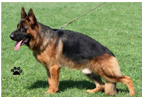
Kronos Nurburgenring VA 2014

Quantum Arminius, Ober Bad - Boll Sieger 2010 videre til de 2 sønner Saabat v. Aurelius VA 2013 og Enosch Amasis VA 2013, videre til VA 2014 Kronos Nurburging.