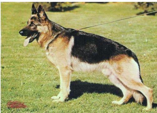
Lasso de Val Sole f. 30.04.1974

2. En anden linie er over Lasso di Val sole måske nok den bedste søn.