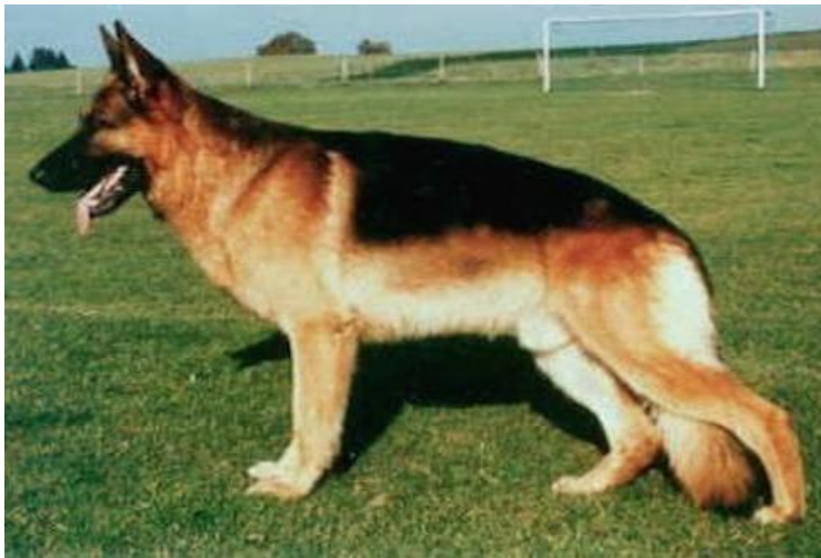
Uran v. Wildsteiger Land f. 12.03.1982 SZ 1526684

En oplevelse var at se afkom efter Uran v. Wildsteiger Land der kunne fylde et helt station med afkom.