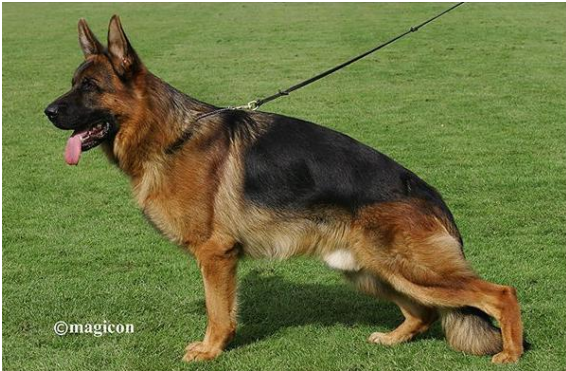
Ballach Bruckneralle VA 2013+2014