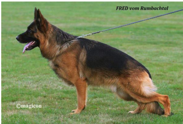
Fred Rumbachtal VA 2014