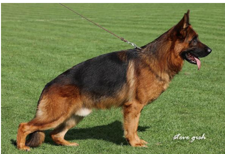
Schumann Tronje VA 2014

Odin Tannenmeise Jeck Noricum Visum Arminius Sieger 1996 Max d. Loggia Dux Valcuvia Quantum Arminius ZampThermodos Sieger 2006 videre til Dux de Intercanina til VA 2014 Schumann Tronje.