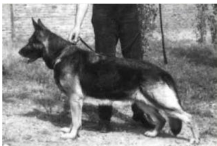
Yoga v. d Wienerau f. 27.03.1965 SZ 1092101

Mor til Quanto v. d. Wienera er Yoga v. d. Wienerau og morfar er Lido v.d. Wienerau