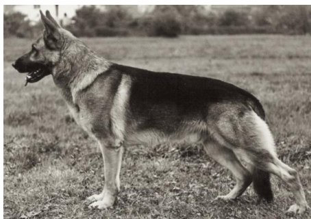
Lido v. d. Wienerau f. 20.05.196 SZ 1029749

Også brugsmæssig har der være gode hunde efter Quanto v. d. Wienerau.