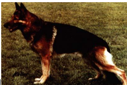
Iwo Lauterstein f. 29.05.1984 SZ 1617957.

Quanto v.d. Wienerau, over Lasso di Val Sole, Gerry v.d. Westfeste, til Bundessieger 1989 Iwo Lauterstein.