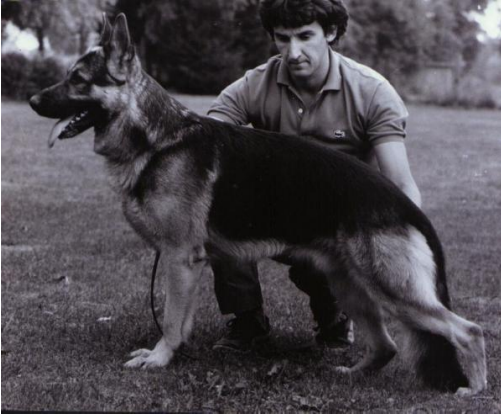
Gerry v.d. Westfeste f. 20.01.1981 SZ 1525241.

Tillad mig at komme med en lille personlig historie om Gerry v. d. Westfeste, som jeg parrede min tæve Friis Wanda med i efteråret 1984. Efter denne parring kom bl.a. Friis Mascha.