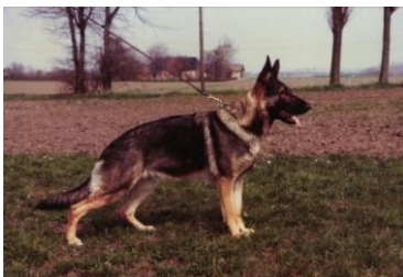
Friis Wanda f. 05.12.1980 AK/1- SchH 111