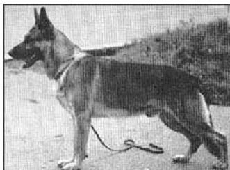
Kerry v. Stahlhammer

Betty v. Bonsdorf er bl.a. moder til A kuldet Neffeltal, hvis fader er den grå Kerry v. Stahlhammer, hvis farfader er Gildo v. Busecker Schloss.