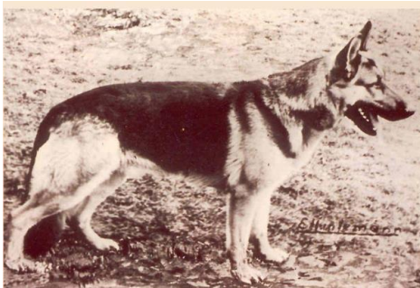
Vello z.d. sieben Faulen

Vello z.d.sieben Faulen var tæt på at komme til Danmark.