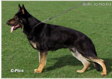
Bolle Ja Na Ka f. 30.05 2011 bundessieger 2014.

Asko v. Lutters sønnen Leon v.d. Staatsmacht havde sønnen Bolle Ja Na Ka som bundessieger i 2014, hvis mor er Bora Excalibur Europa, som på sin side fører bl.a. Nich v. Herligenbösch.