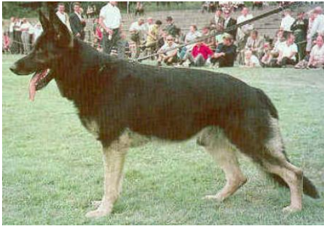
BODO v. LIERBERG