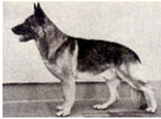
Pollux v. Busecker Schloss f. 18.marts 1964-grå

Pollux v. Busecker Schloss var efter Valet v. Busecker Schloss og den grå Uri v. Busecker Schloss.