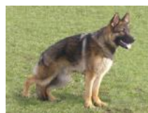
Friis Kronos VA (A) Lorenzo v. Isidora Friis Hetta