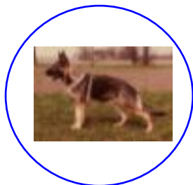
Friis Wanda VA Wanko v. d. Maaraue Friis Kitt