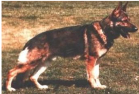
Sagus v. Busecker Schloss f.19.juni 1977.