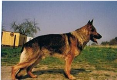
Half v. Busecker Schloss f.6.juni 1983.