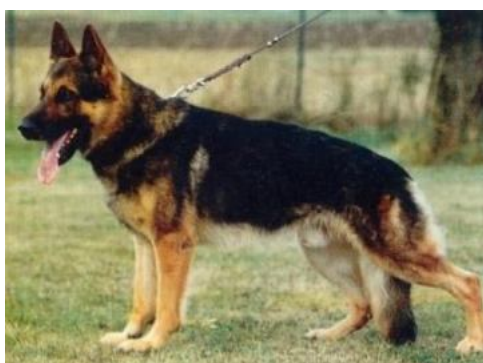
Turo v. Busecker Schloss f. 17. februar 1985.

Turo v. Busecker Schloss fik ved FCI-Europamesterskabet i Schweiz i 1989 en topplacering med 98 i A og 97 i C.