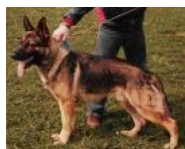
Friis Argus VA Wasko v.d. Niersbrücke Friis Kitt