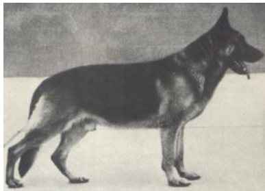
Valet v. Busecker Schloss f. 17. maj 1957

Zita v. Busecker Schloss er efter Jonny v.d. Riedperle, moderen er Petra v. Busecker Schloss, hvis moder er Kara v. Busecker Schloss.