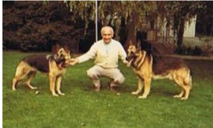
Lyngs Glenni med sin far Pollux v. Busecker Schloss.

Pollux v. Busecker Schloss var en herlig hund, som jeg personligt kendte godt og satte meget stor pris på. Jeg har altid ønsket, at jeg kunne lave en hund som ham med et så herligt væsen.