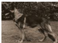
Friis Dargo Friis Amor Fenja v.d. Malzmühle