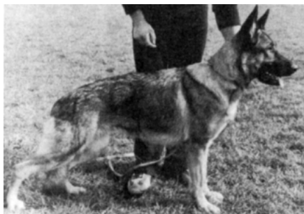
Pleuni v. Busecker Schloss f. 12. februar 1977.

Pleuni v. Busecker Schloss var tidligere solgt til Holland. Hun var efter Zarno v. Holtkämper See og Innes v. Busecker Schloss.