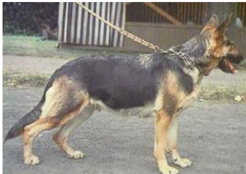
VA Seffe v. Busecker Schloss f. 5. november 1964.

En fremragende avlstæve, som har bragt mange fremragende hunde.