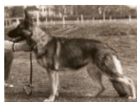
Friis Festa Friis Amor Fenja v.d. Malzmühle