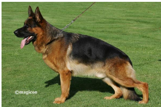
Labo Schlossweiher VA 4 2015