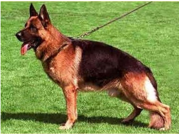
Kimon v. Dan Alhedy,s Hoeve Sieger 1994

En anden linie går fra Canto v. d. Wienerau over Frei v. Holtkämper See, Zorro v. Haus Beck, Lasso Wiedenbrücker Land, Fedor Arminius og Mark v. Haus Beck til sieger 1994 Kimon v. Dan Alhedy,s Hoeve, her slutter linien.