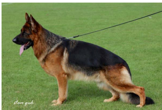
Yuri v. Osterberger Land SZ 2277272 f. 06.02.2012 VA 8 2015 og VA 9 2016. Moderen er Qucki v. drei Birkenzwinger.