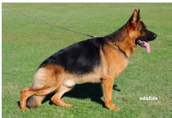
Fulz di Zenevredo VA 2013

Quenn v. Löher Weg sønnen Paer Hasenborn der blev VA i 2013 har den smukke søn Etoo aus Wattenscheid som blev VA i 2013.