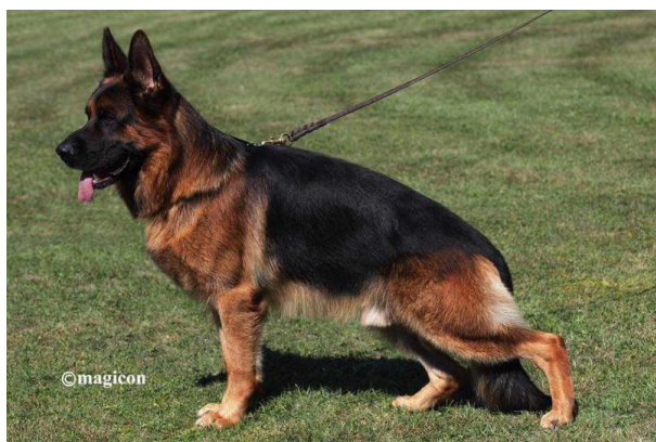
Willy Kuckuckland VA 7 - 2016 SZ 2292960 f.14.04.2013 SW 72

Remo Fichtenslag sønnen Opus Radhaus fik sønnen Willy Kuckucksland som blev VA 7 i 2016.