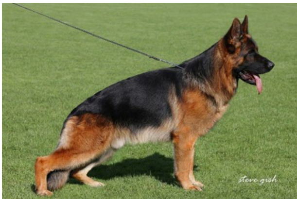
Gary v. Hühnegrab SZ 2293412 f. 17.03.2013.

Moderen er Jalmari v. Hühnegrab som er en datter af Dux de Intercanina.