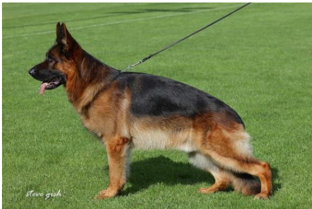
VA 4 Marlo v. Baccara SZ 2288916 f. 12.12.2012

Mor er VA Yakimo v. Feuermelder som er barnebarn af VA Yukon v. d. Bastillie.