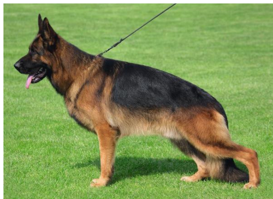
Omen Rathaus VA 2013

I faderlinien var som sagt sieger 2011 og 2012 Remo v. Fichtenschlag der i 2013 havde 3 sønner der fik VA Auslese. Det var sønnerne Illiano Fichtenschlag, Cobra Ulmental og Omen Rathaus.