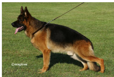
Saabat v. Aurelius VA 2013