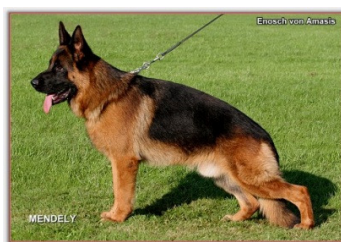
Enoch Amasis VA 2013