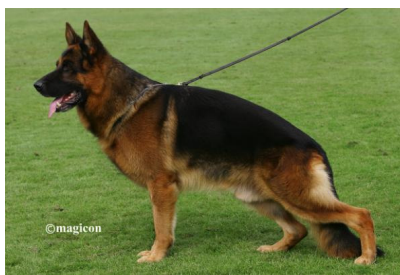
Mentos Osterberger Land VA 2013 -2014