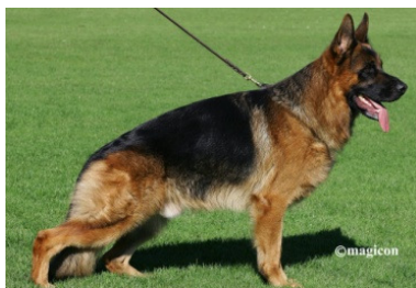
Etoo aus Wattenscheid VA 2013