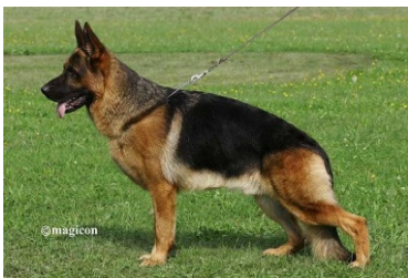
Cobra Ulmental VA 2013

Illiano Fichtenschlag fil i 2016 sønnen Djambo v. Fichtenschlag i ausleseklassen som blev VA 10.