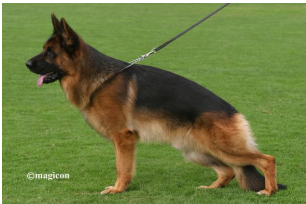
Yankee v. Feuermelder VA 2013

Hill v. Farbenspiel søn Yukon v. Bastille, får sønnen Joker v. Eichenplatz, der igen får sønnen Yankee v. Feuermelder der blev VA i 2013.