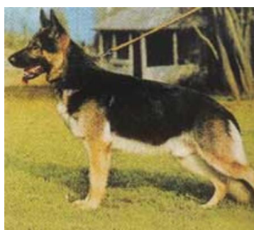
Marko v. Cellerland Sieger 1972

Marko v. Cellerland (Kondor v. Golmkauer Krug - Cilla v. Hünenfeuer) blev Sieger i 1972.