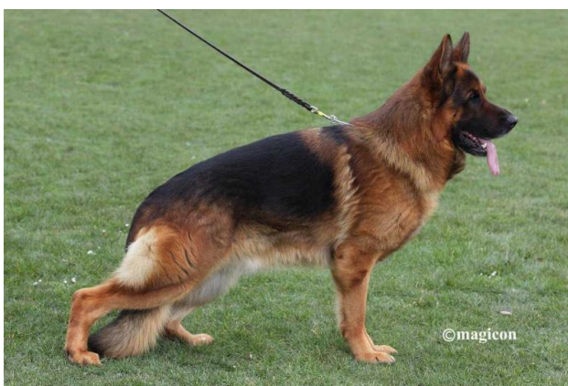
VA 6 Risco v. Suentelstein SZ 2279657 f.15.12.2011.

Fulz di Zenevredo har videre ført linjen til sønnen VA 6 - 2016 Risco v. Suentelstein.