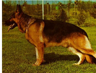
Quanto v.d. Wienerau VA

Mutz v. d. Pelztierfarm linien fik en ny æra i 2011 da Remo v. Fichtenschlag blev Sieger, det samme blev han i 2012.