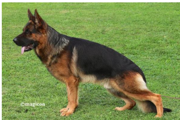
Cronos Seprio VA 3 ROI 13/35464 SZ 2304505 F. 25.12.2012.

Moderen er Afra del Seprio som er Barnebarn af VA 6 Dux della Valcuvia.