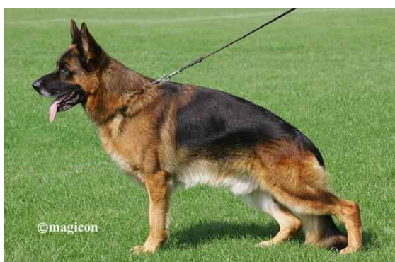
Vegas du Haut Mansard Sieger 2008 og 2009.