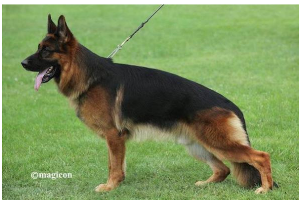
Djambo v. Fichtenschlag VA 7 - 2015 - VA 10 - 2016

Illiano Fichtenschlag fil i 2016 sønnen Djambo v. Fichtenschlag i ausleseklassen som blev VA 10.