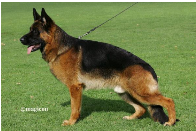
VA Atos Agriento SZ 2237607 f. 29.05.2009