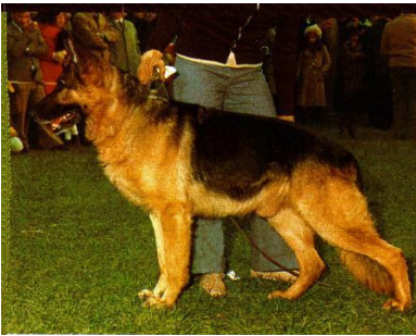
Mutz v.d. Pelztierfarm VA

Mutz v.d. Pelztierfarm er indavlet 3-3 på Regina v. Colonia Agrippina.