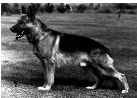
Canto v.d. Wienerau V 1

Canto v. d. Wienerau er indavlet 5-4 på Hein Richterbach, Axel v. Deiningshauserheide 5,5-5,5 og Rolf v. Osnabrücker Land Rolf-Ina 5-5.