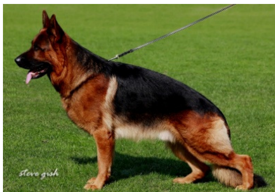
Chacco Freiheit Westerholdt VA 2013

Zamb v. d. Wienerau har også ført linien videre til Chico v.d. Lohner Heide, Wobo Lärchenhain, Jango Füssenberg, Esko Danischen Hof, Mark Schwalmbergtal, Yerom v. Haus Salihin til VA i 2013 Chacco Freiheit Westerholdt.