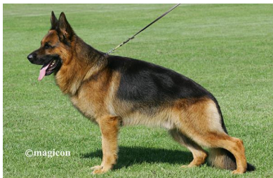
Remo Fichtenschlag Sieger 2011 - 2012

I 2014 kom der flere sønner i ausleseklassen efter Remo v. Fichtenschlag det var Pacco v. Langenbungert, Illiano v. Fichtenschlag, og Omen Rathaus.