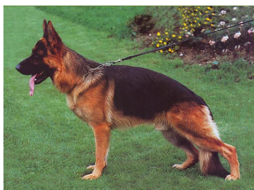
Lasso v. Neuen Berg Sieger 1997