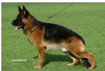
Athos aus Agriento VA 2014

Ursus v. Batu linien er også ført videre over Uran v. Moorbeck, Queen Löher Weg Tyson Köttersbusch til VA 2 Willas Grafenbrunnen.