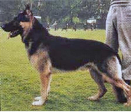
Sieger 1965 Hanko Hetschmühle SZ 1029585 f. 04.06.1962