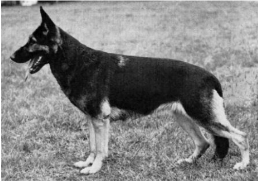
Siegerin 1965 Landa v.d. Wienerau SZ 1029754 f. 20.05.1962

I dette Kuld var også Siegerin 1965 Landa v. d. Wienerau.