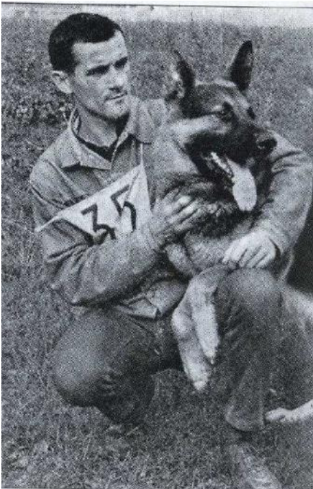
Bundessieger 1964 Bingo v. Ritzerbachtal SZ 1022282 f. 07.10.1961 (Harras V. Elbachtal - Burga v. Ritzerbach)