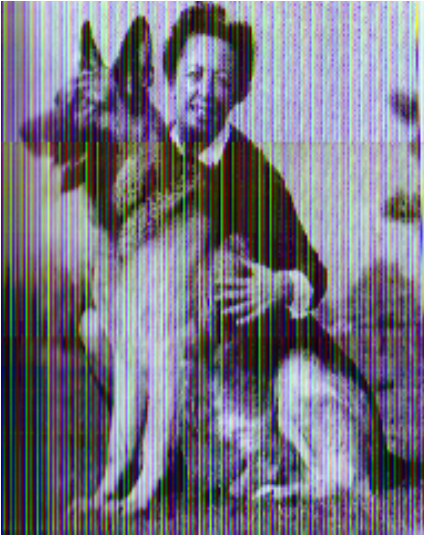
Bundessieger 1962 Anderl v. Wissblauen SZ 940829 f. 29.03.1957 (Artus a.d. Chan-Geschlecht - Anja v. Haus an Berg)