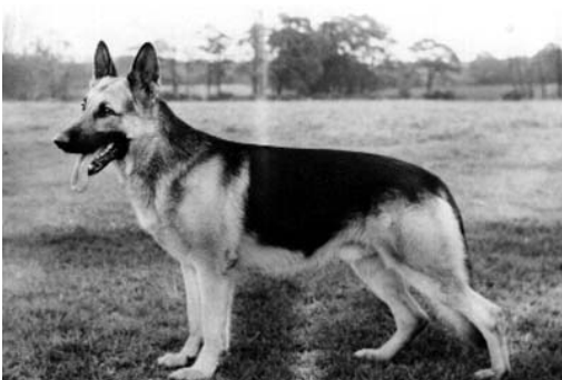
Sieger 1962 Mutz a.d. KÜchstrasse SZ 958988 f. 18.04.1958

På siegerschau 1962 blev vinderen Mutz a.d. KÜchstrasse.