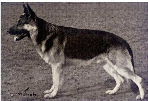
Sieger 1963 Ajax v. Haus Dexel SZ 996023 f. 24.05.1960