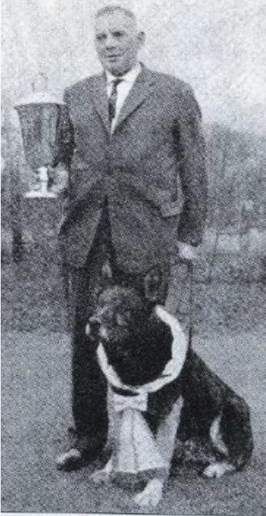
Bundessieger 1963 Alf v. Stimbergrand SZ 944907 f. 12.06.1957 (Heiko v. Böhmershof - Burga v. Ritzerbach)