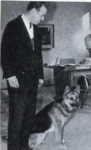
Bundessieger 1965 Bleck v. Unteren Wallberg SZ 995614 f. 06.06.1960 (Neck v.d. Domäne Verchen - Akja zur Steinernen Brücke)