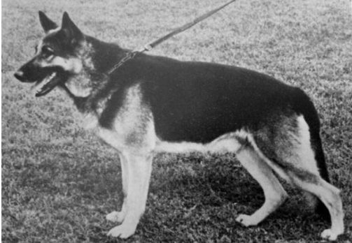
Sieger 1964 Zibu v. Haus Schütting SZ 971574 f. 30.01.1959