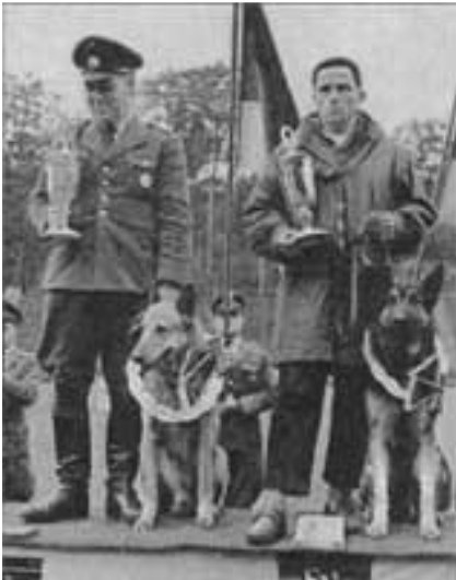
Bundessieger 1961 Benno Stolper Land SZ 930450 f. 04.05.1956 (Illo v. Meller Land - Vita v. Timbergland).