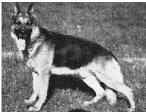
Ebbo v. Astener Moor

En anden fremragende avlstæve efter Bernd v. Iierberg er Betty v. Bonsdorf, som var tysk Bundessieger i 1968 og 1972.