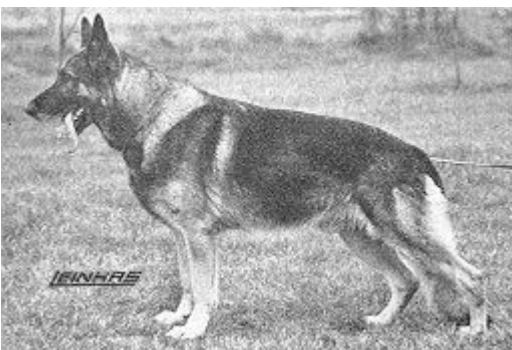
V2 1967 Nico v. Haus Beck f.12.02.1963 grå SZ 1047103