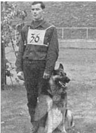
Bundessieger 1967 Bingo v. Ritzerbachtal SZ 1022282 f. 07.10.1961.