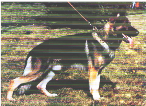
VA Wanko v.d. Maaraue SZ 1439364 f. 19.06.1978

Boss v. Amalienhof blev senere fader til den grå VA 1981 Wanko v.d. Maaraue.