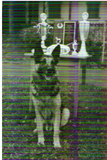
V 2 Rocco v. Busecker Schloss SZ 1219219 f. 30.09.1972. far er Ebbo v. Astener Moor