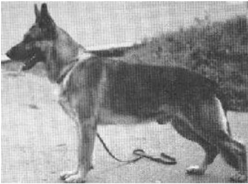
Kerry v. Stahlhammer

En anden kendt hund er Boss v. Amalienhof, som havde Bernd v. Lierberg som farfar.