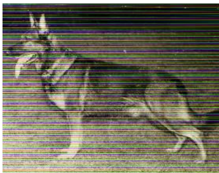
Ari v. Neffeltal

Igen kan vi se at med en god moder, så kommer det også til fremgang avlsmæssigt.