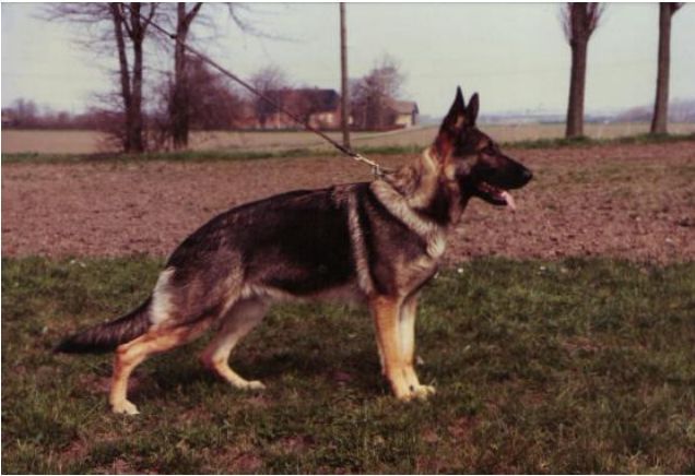
Friis Wanda AK/1 SchH 111. V. grå.

En meget smuk datter af Wanko v.d. Maaraue er Friis Wanda, som opnåede mange topplaceringer.