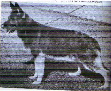
Bodo v. Lierberg Sieger 1967 SZ 1026197 f. 16.03.1962 SchH III FH Kørkl. 1 a HD fri