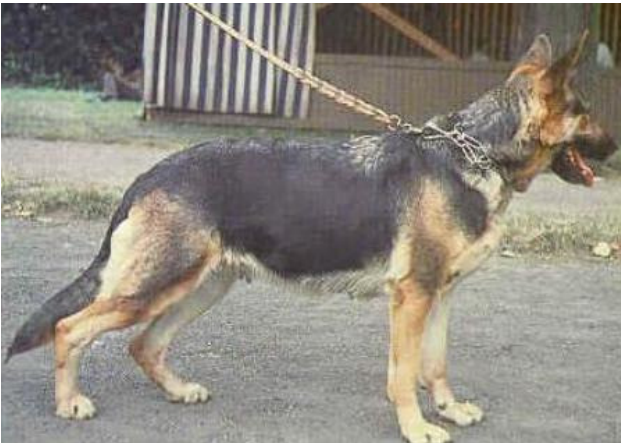
VA Seffe v. Busecker Schloss SZ 1080706 f. 05.11.1964

Seffe v. Busecker Schloss er datter af Issel v. Busecker Schloss som er en datter af Valet v. Busecker Schloss.