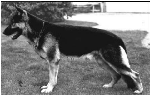
Sieger 1966 Basko v.d. Kahler Heide SZ 1045002 f. 18.11.1962