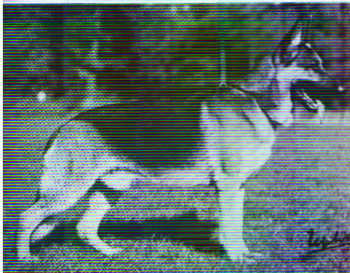
Bundessieger 1959- 1960 Volker v. Zollgrenzschutz.