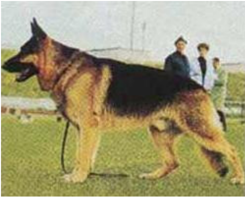
Sieger 1971 Arras v. Haus Helma SZ 1131467 f. 25.02.1967. (Tom v. Haus Solms - Dixie v.d. Rokokoperle).

En hund som ikke havde den store interesse hos opdrætterne.