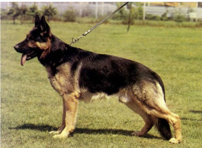
Sieger 1973 Dick v. Adeloga SZ 1233847 f. 01.03.1971 (Quanto. v.d. Wienerau - Asta v.d. Modauquelle).