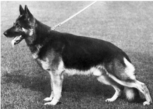
Sieger 1972 Marko v. Cellerland SZ 1169323 f. 03.05.1968