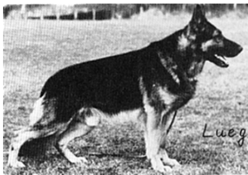
VA Bert v. Haus Knüften f. 18.10.1962 SZ 1037761

(Mike v. Bungalow - Tanga v. Basalthügel en datter af VA Bert v. Haus Knüften.