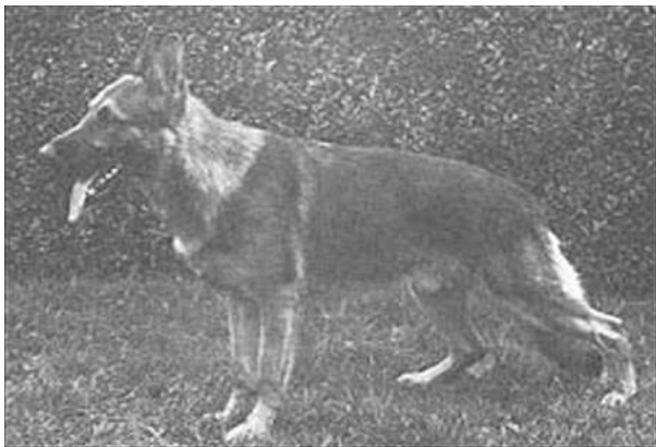
Jago v.d. Jungen Hansen f. 08.08.1969 grå SZ 1191967

(Mike v. Bungalow - Tanga v. Basalthügel en datter af VA Bert v. Haus Knüften.