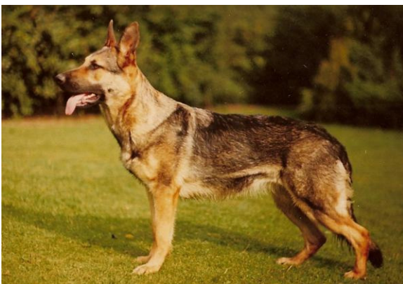
Fenja v.d. Malzmühle DK 10560/73 f. 11.07.1972 grå (Gin v. Haus Pari - Vilja v.d. Malzmühle grå).

Vilja v.d. Malzmühle er mor til Fenja v.d. Malzmühle som blev importeret af kennel Friis.