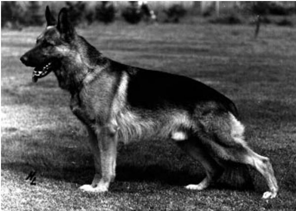
V 1 Canto v.d. Wienerau SZ 1176588 f. 19.09.1968

Det viste sig senere at Canto v. d. Wienerau var bløder, og dette anlæg gav han videre til sine døtre.