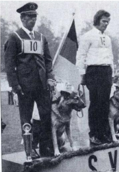
Bundessieger 1973 Gero v. Porzenacker SZ 1188317 f. 01.04.1969 (Arno v. Wickrather Schloss - Heike v. Rockenbrunn)