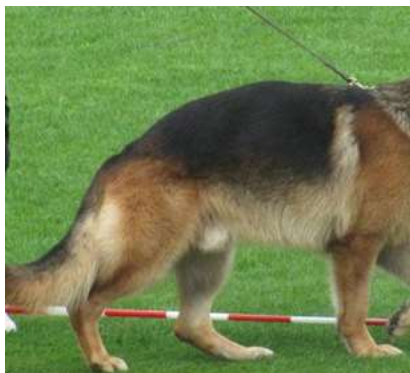
hund med tydelig karperyg.

Jeg tænker her på bedømmelse af hundens hældning på ryggen - karperyg, bækkenet, kryds og lemmer og især løse haser.